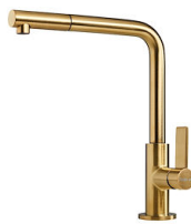
VELA PLUS GOLD satiniert