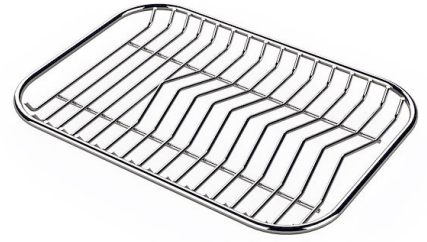
Tellerständer aus Edelstahl