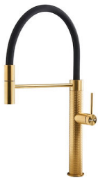
Mischbatterie Skin Gold