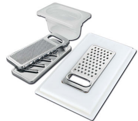
Satz Reibe mit Halterung für Ring und Auffangschale 8159 101 * nur in Kombination mit dem Zubehör 8644 101