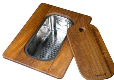
Schneidebrett Twin aus Iroko-Holz mit Küchensieb aus Edelstahl 8644 044